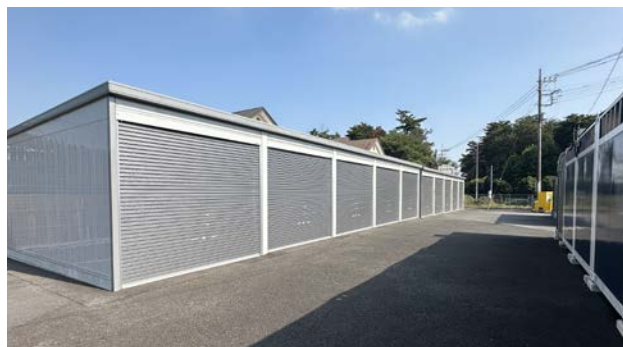
バイク、ショールーム等複合物件事例 CASTRA入間市小谷田・ ブルーストレージ小谷田第1・第3