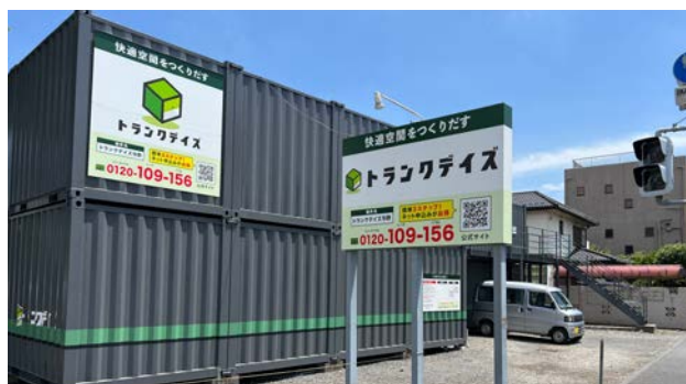
コンテナリニューアル物件事例(OPEN2014年) トランクデイズ与野